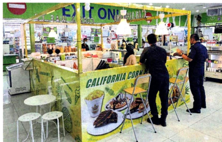
■执法员进入商场查执照。

针对民众投诉小贩问题,执法员分别到辉煌镇、加影综合车站以及加影工艺城执法,其中在加影综合车站充公两个小贩棚架。