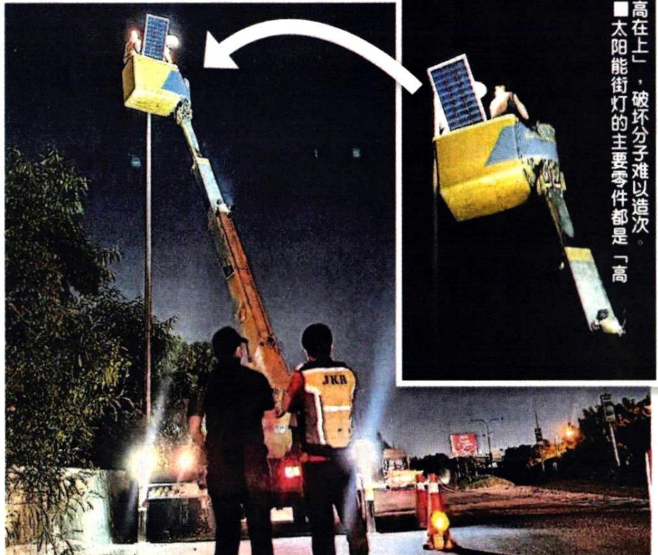
■「高高在上」,破坏分子难以造次。太阳能街灯的主要零件都是「高高」