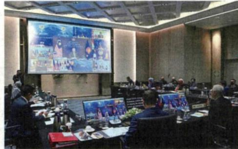
Unity speaks volumes: Ismail Sabri speaking during the 38th and 39th summits via virtual conference. Also present were Foreign Minister Datuk Saifuddin Abdullah and Senior Minister and International Trade and Industry Minister Datuk Seri Mohamed Azmin Ali.

In an unprecedented move, Asean on Oct 15 agreed to bar Myanmar's military chief Min Aung Hlaing, who toppled a civilian government on Feb 1, over his failure to implement a peace plan he agreed with Asean