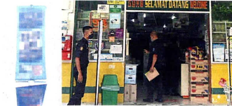
■加影市议会正在各地区检查商家的商业执照。