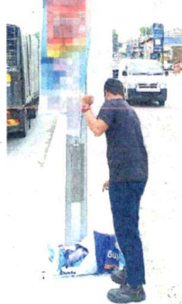
■执法员拆下路边非法广告条幅。