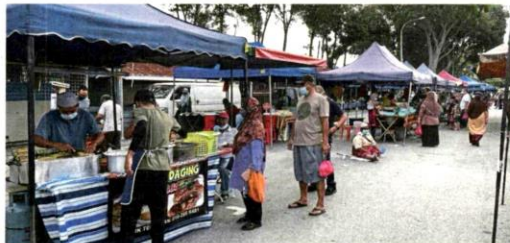
Shoppers at a night market in Kampung Raja Uda, Klang, queuing up while maintaining physical distancing.

Sharin added that MBSA's Health Department had made it compulsory for each trader to have a temperature scanner and hand sanitiser.