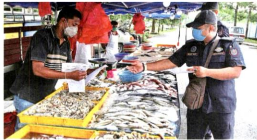
MBSA enforcement officers checking on traders of a morning market to ensure compliance with the Covid-19 SOP.